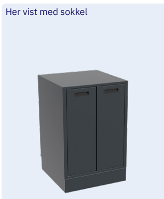
Varenr. 132B0012-B-7016-7016 Affaldsbeholder med 4 rum Udv. mål i mm.: H: u/sokkel 790 m/sokkel 920 B:600 D:600