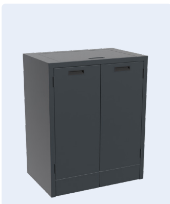
Varenr. 132B0011-B-7016-7016 Affaldsskab til egne beholdere (Med "visuel" sokkel på låger) Udv. mål i mm.: H:1120 B:900 D:600