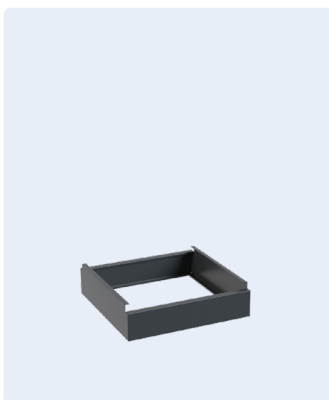
Varenr. 118D0360-7016 Lukket sokkel Mont. H:130 mm Udv. mål i mm.: H:168 B:600 D:600