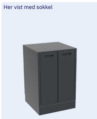
Varenr. 142H0016-B-7016-7016 Affaldsskab forberedt for beholder Udv. mål i mm.: H: u/sokkel 790 m/sokkel 920 B:600 D:600