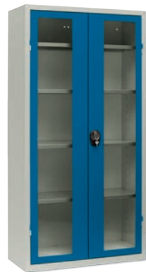
131V000114 (+ 4 stk. 431V0008)