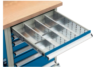
Stålinddeling 4 x 110 mm.