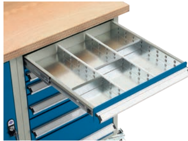
Stålinddeling 3 x 148 mm.